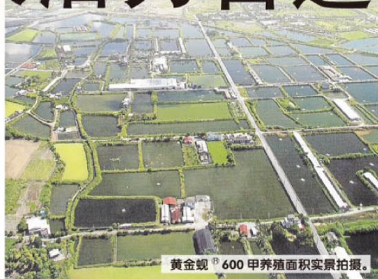
黄金蚬 ® 600 甲养殖面积实景拍摄。

58, Jalan Puteri 2/4, Bandar Puteri, 47100 Puchong Selangor, Malaysia Tel : 03-8063 7889 website: www.biogreeno.com