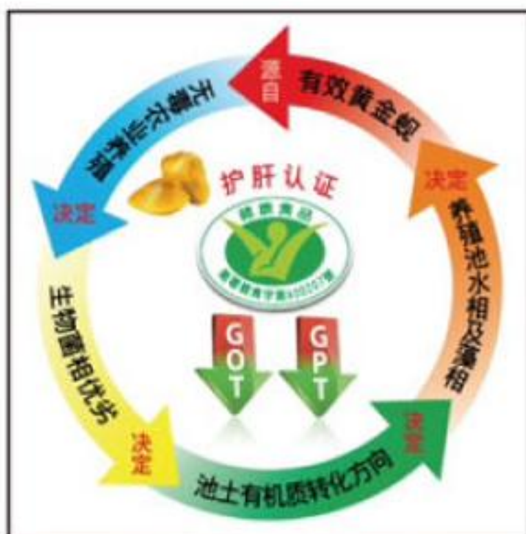
黄金蚬 ® 养殖循环图。

专家指出，肝，是养出来的，而非治好的。当肝生病时，如果还要服用药物来加强其负担，试问，肝的问题会减轻吗？反之，肝脏问题就会日趋严重，甚至威胁生命。