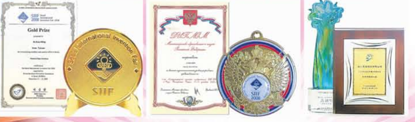
2008韩国首尔发明展“金牌奖” 俄罗斯“人类健康贡献特别奖” 菁创奖