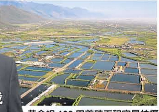
黄金蚬 600 甲养殖面积实景拍摄