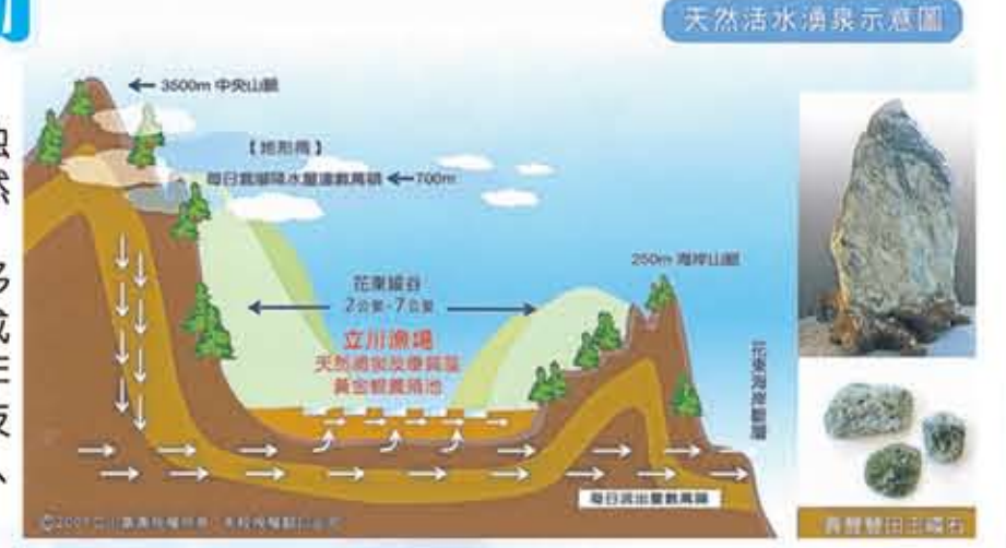
天然活水清泉示意图

天然丰田玉等多种独特矿石过滤所形成的活水涌泉、立川多年累积研究的独有技术、融合研发出高品质、高有效性的蚬精产品。