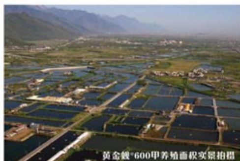
黄金蚬®600甲养殖面积实景拍摄

肝病是无声杀手，唯有给予肝脏所需的天然完整养分，才能强化及快速修护它的功能，以确保身体的真正健康。