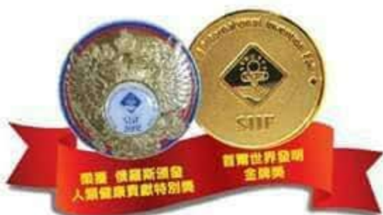
全球唯一榮獲發明展雙料獎項

然而提到鈣一定要提到全球唯一榮獲「生醫界奧運」金牌獎及「人類健康貢獻特別獎」雙重殊榮的「蜆鈣好」-Bio Greeno. Golden Clam Cal Plus，「BioGreeno蜆鈣好」是由全球黃金蜆唯一生產製造原廠的立川漁場，運用最新的「螯合技術」將蜆殼創新研發成可同時修護硬骨、軟骨的蜆鈣，更大大提升鈣離子的吸收率，且消化過程中不會在小腸形成氫氧化鈣的沈澱物，因此完全沒有形成「結石」的疑慮，立川集團以最新的Probiomin專利技術將黃金蜆殼的碳酸鈣螯合成「生物性離子化氨基酸鈣」有助人體的吸收率提升達80~95%，可說是生醫界突破性的發明，成為唯一榮獲國際發明展的雙重殊榮。